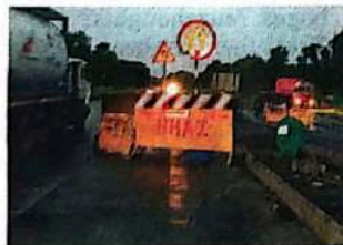
The work is ongoing on a 121-km stretch of NH-48