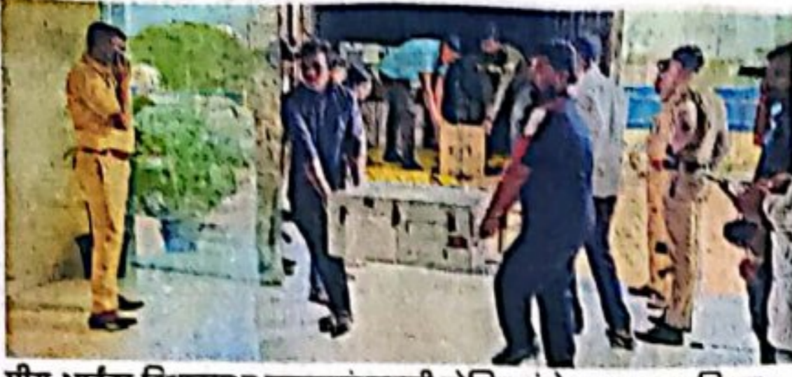
मीरा-भाईदर विधानसभा मतदारसंघासाठी पोलिस बंदोबस्तात छायाचित्रण करून यंत्रे बंदिस्त पेठ्यांमध्ये आणण्यात आली.