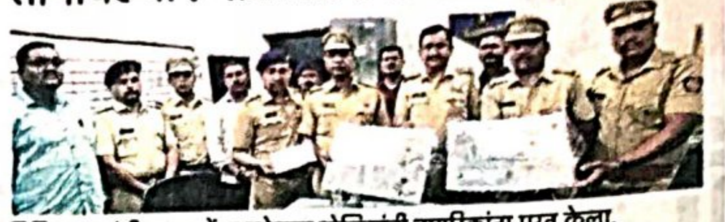
विविध गुन्ह्यांतील लाखोंचा मुद्देमाल पोलिसांनी नागरिकांना परत केला.