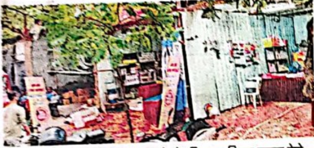
फटाक्यांच्या विक्री स्टॉलकरिता काटेकोर नियम व निकष घालून देणे गरजेचे असताना मीरा-भाईदरमध्ये सर्रास स्टॉल लावलेले दिसत आहेत.

अॅप डाऊनलोड करण्यापूर्वी त्याच्या सत्यतेची पडताळणी करावी, कोणताही अनोळखी कॉल आल्यास क्रेडिट कार्ड / बँकशी संबंधित माहिती देऊ नये, अथवा ओटीपी शेअर करू नये, क्रेडिट कार्डद्वारे व्यवहार करताना त्याची माहिती कोठेही सेव्ह करू नये, असे आवाहन सायबर अधिकाऱ्यांनी केले आहे.