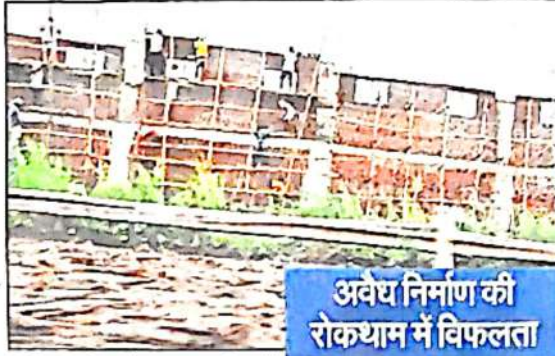
अवैध निर्माण की रोकथाम में विफलता