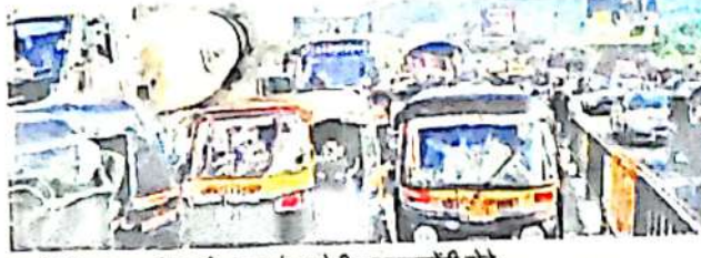
वसई-विरार शहरातील अनेक रस्त्यांवर मोठी वाहतूककोंडी होते.

पुलांची संख्या कमी असून, त्यामुळे वाहतूकीवर ताण पडत होता. सध्याकालच्या वेळेस अधिक वाहतूककोंडी होते, अशा ठिकाणची कोंडी सोडविण्यासाठी उद्घाणपूल उभारले जाणार आहेत, जेणेकरून वाहतूक सुरळीत होण्यास मदत होईल आणि नागरिकांच्या वेळेची व इंधनाचीही बचत होईल.