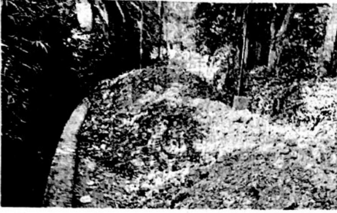
वसई तालुक्यात भूमाफिया, मातीचोर व बेकायदा बांधकामधारक मोठ्या प्रमाणात सक्रिय झाले असून माती भराव केला जात आहे.