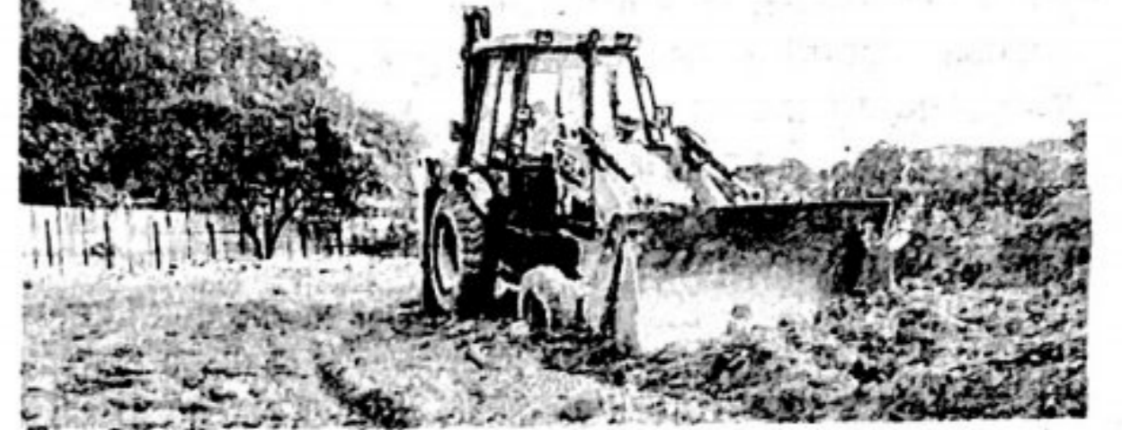
जाफरी खाडी क्षेत्र, वसई खाडी किनारा, संजय गांधी राष्ट्रीय उद्यानालगतच्या भागात माफियांकडून भरणी सुरू आहे.

मीरा-भाईदरमध्ये भरणी माफियांना राजकारण्यांसह पोलिस, पालिका व महसूल, तसेच वन विभाग प्रशासनाचा आशीर्वाद असल्याचे लपून राहिलेले नाही, असा आरोप स्थानिकांकडून केला जात आहे. भरणी माफियांच्या बेकायदा डेब्रिज आणि माती-गाळाच्या भरणीमधून लाखो रुपयांची उलाढाल होतेच, शिवाय भूखंड तयार करून दिले जातात. त्यामुळे शहरात राजरोस बेकायदा डेब्रिज-मातीची वाहतूक करणाऱ्या वाहनांना सर्वच प्रशासनाचा वरदहस्त राहिला आहे. शिवाय अगदी रस्ता, खाडी, नाला, कांदळवन क्षेत्र, सीआरझेड, इकोसेन्सेटिव्ह क्षेत्र आदी प्रतिबंधात्मक क्षेत्रात सर्रास भरणी केली जात आहे.