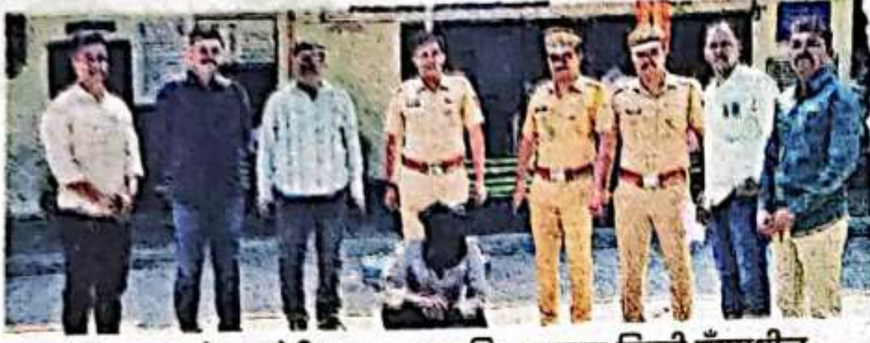
वाहनांची काच फोडून चोरी करणाऱ्या तामिळनाडूच्या तिरची गँगमधील आरोपीला पोलिसांनी अटक केली आहे.