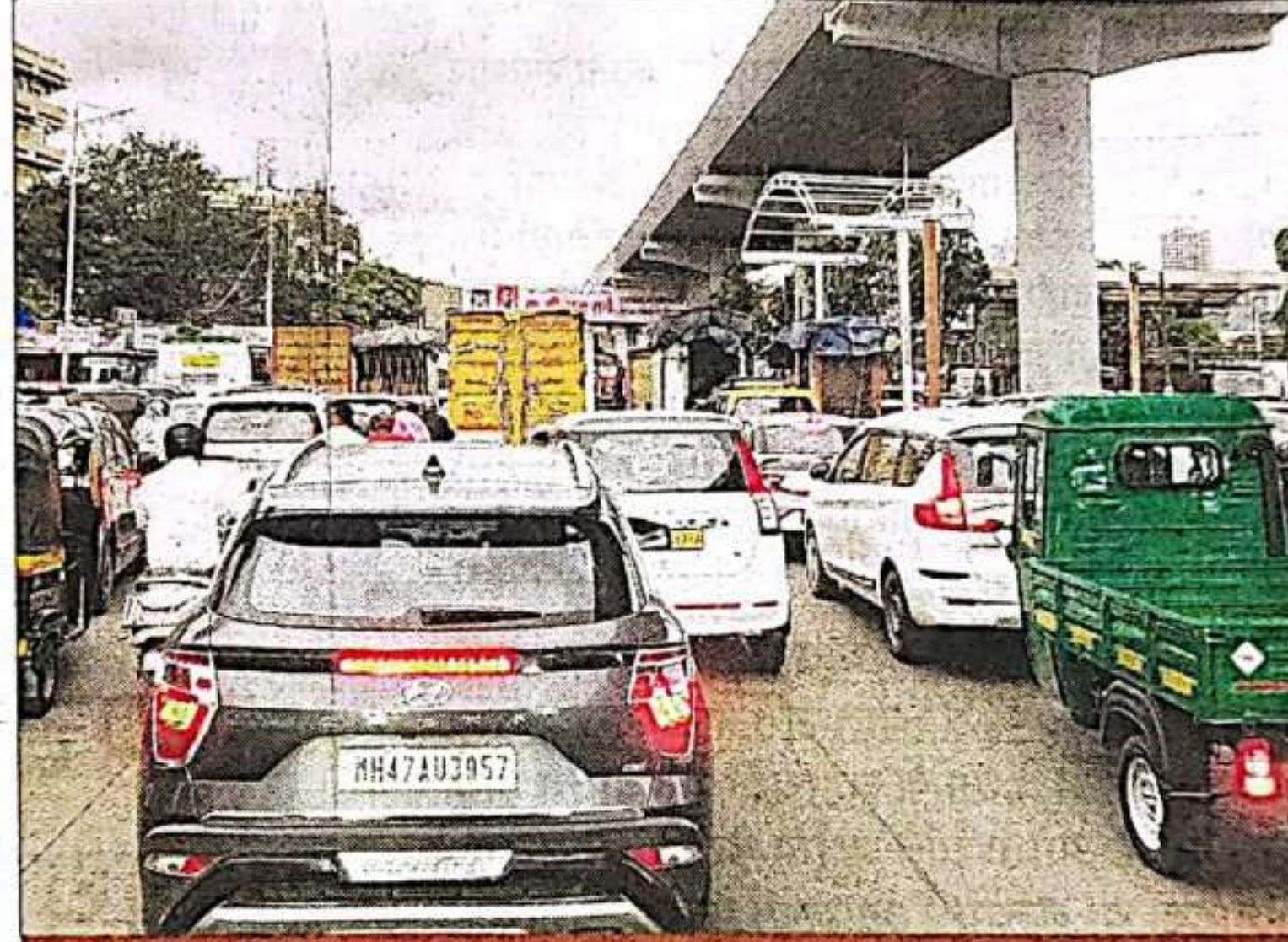
नियोजित लिंक रोड टोलमुक्तच पाहिजे

मिरा-भाईदरच्या दक्षिण वेशीवर असलेल्या दहिसर टोल नाका हा वाहतूक कोंडीच्या नावाने डोकेदुखी ठरत असून त्यावर कोणत्याही सरकारने अद्यापही ठोस उपाययोजना केलेली नाही. तत्कालीन महायुती सरकारने मुंबईच्या प्रवेशद्वारावर असलेल्या सर्व टोल नाक्यावरील टोल धाडीतून हलक्या वाहनांची सुटका केल्याचे जाहीर केले. यामागे त्या-त्या टोलनाक्यांवर होणाऱ्या वाहतूक कोंडीची समस्या निकाली निघेल, असा कयास लावला गेला. मात्र तत्कालीन सरकारचा हा कयास फुसका वार ठरल्याने येथील वाहतूक कोंडी नित्यनियमाचीच झाल्याचा प्रत्यय येथून प्रवास करणाऱ्या प्रवाशांना येऊ लागला आहे. त्याचा फटका तातडीच्या सेवा देणाऱ्या वाहनांना देखील पूर्वीसारखाच वसू लागल्याने टोल माफीचा उतारा वाहतूक