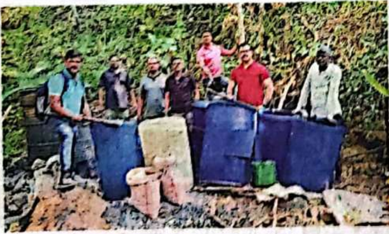
कामण गावातील देवकुंडी जंगल परिसरात बुधवारी पोलीसांनी छापा मारून हातभट्टीची दारू तयार करण्याचे साहित्य नष्ट केले.