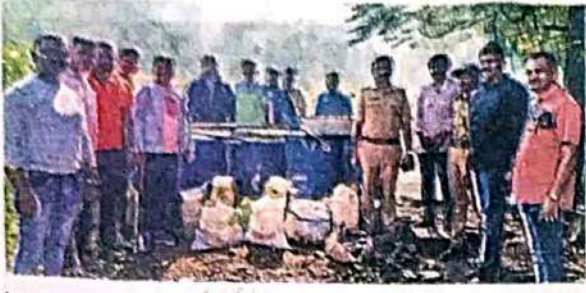
पेल्हारच्या गुन्हे प्रकटीकरण शाखेच्या पोलिसांना अवैध दारू तयार करण्यासाठी लागणारे साहित्य जप्त करून नष्ट करण्यात आले.