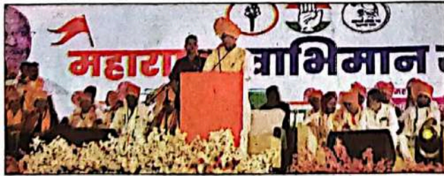
मल्लिकार्जुन खरगे ने वसई में सभा को संबोधित किया।

इस दौरान, खरगे ने कांग्रेस के चुनावी वादे दोहराए। उन्होंने कहा कि महाविकास