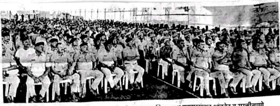
मीरा-भाईदर-वसई-विरार पोलिस आयुक्तालय हद्दीत येणाच्या पाच विधानसभा मतदारसंघात शांततेत व सुरळीतपणे निवडणूक प्रक्रिया पार पडावी, याविषयी सूचना देण्यासाठी पोलिसांची बैठक आयोजिली होती. (छाया : धीरज परब).