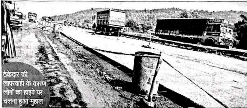
ठेकेदार की लापरवाही के कारण लोगों का हाइवे पर चलना हुआ मुहाल

गड्डों से निजात पाने वाइट टॉपिंग बनाने का लिया था निर्णय: गौरतलब है कि हाइवे पर गड्डों और जलभराव से छुटकारा पाने के लिए एनएचआई ने मुंबई-अहमदाबाद हाइवे पर गुजरात बॉर्डर के तलासरी से लेकर काशीमीरा तक वाइट टॉपिंग (कॉन्क्रीट) बनाने का निर्णय लिया, जिसके लिए 621 करोड़ रुपये का बजट भी पास किया गया था। फरवरी-2024 में इस काम का ठेका निर्मल बिल्ड इंफ्रा नामक कंपनी को दिया गया, लेकिन हाइवे पर वाइट टॉपिंग में बरती जा रही लापरवाही के कारण वहां से गुजरने वाले पिछले आठ महीनों से परेशान हो रहे हैं। बड़ी बात ये है कि वाइट टॉपिंग के दौरान जगह-जगह अधूरे पड़े निर्माण कार्यों की वजह से कई हादसे हुए और इन हादसों में अब तक 60 से अधिक लोग अपनी जान गंवा चुके हैं।