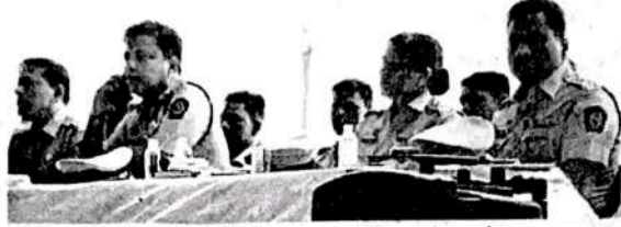
जिल्ह्यात मतदानाच्या पार्श्वभूमीवर कडक पोलिस बंदोबस्त ठेवला असून यासंदर्भात अधिकारी, कर्मचाऱ्यांना पोलिस आयुक्तांनी मार्गदर्शन केले.

परिमंडळ-२ आणि ३ मधील ११ पोलिस ठाण्यांच्या हद्दीत बोईसर, नालासोपारा आणि वसई हे तिन्ही मतदारसंघ येतात. यामुळे तिन्ही मतदारसंघांच्या बुधवर तसेच परिसरात पोलिसांची करडी नजर राहणार आहे. अनेक ठिकाणी नाकाबंदी केली जाणार असून, दिवसभर पेट्रोलिंगही राहणार आहे. सर्व पोलिस ठाण्यांच्या पोलिस अधिकाऱ्यांनी त्यांच्या कार्यक्षेत्रातून विधानसभा निवडणुकीच्या पार्श्वभूमीवर रूट मार्च काढलेला आहे.