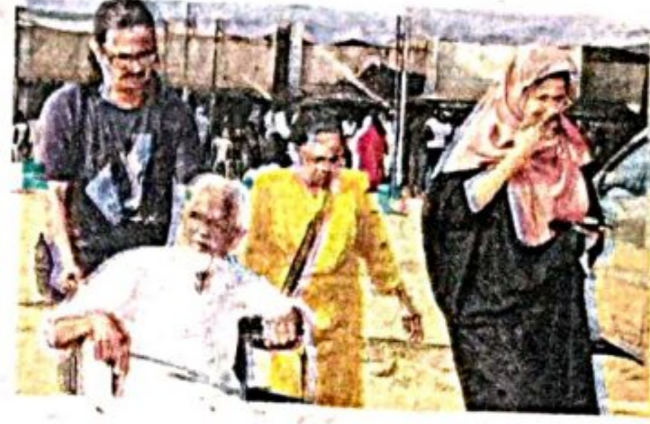
मतदारांनी मतदानाचा हक्क बजावताना मागील वेळेपेक्षा जास्त मतदान केले आहे.