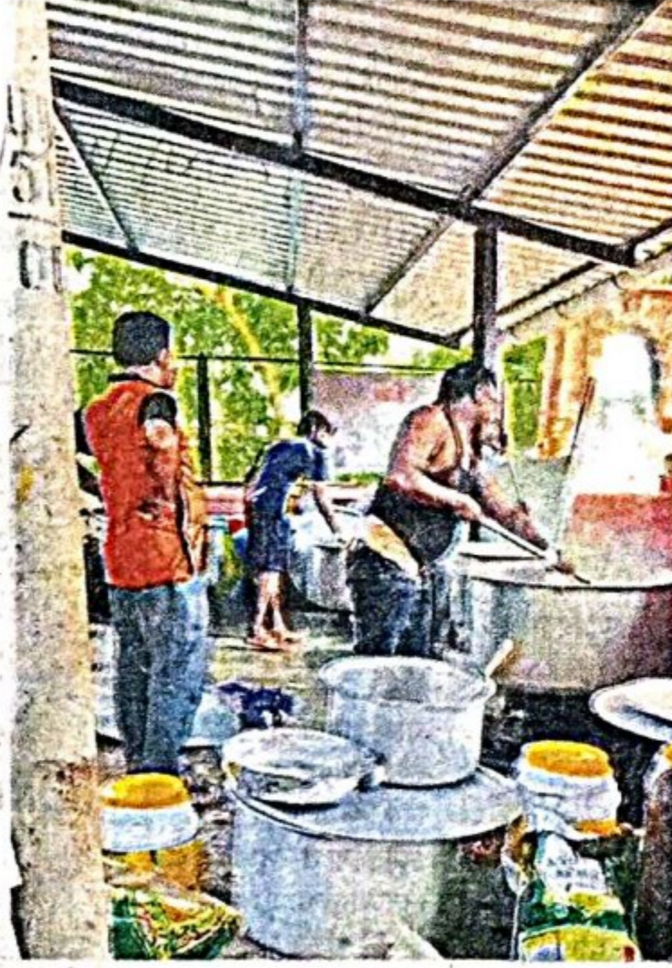
नाश्ता व जेवण महिला बचत गटांच्या महिलांमार्फत बनवून वितरित करणे अपेक्षित असताना जेवण मात्र कॅटरर्सच्या पुरुष कर्मचाऱ्यांनी बनवले.

मीरा-भाईंदर मतदारसंघातील ५०३ मतदान केंद्रांवर बुधवारी उत्साहात मतदान पार पडले. निवडणुकीच्या अनुषंगाने मतदान केंद्रातील कर्मचारी एक दिवस आधीच साहित्यासह केंद्रावर पोहोचले होते. १९ नोव्हेंबर रोजीच्या रात्रीचे कर्मचाऱ्यांसाठीचे जेवण, मतदानाच्या दिवशी २० नोव्हेंबर रोजी सकाळचा नाश्ता आणि दुपारचे जेवण यासाठी महिला बचत गटांना काम दिले गेल्याचे सांगण्यात आले होते. एकूण ५०३ मतदान केंद्रांतील कर्मचाऱ्यांसाठी ही व्यवस्था केली गेली होती.